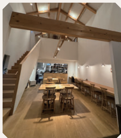
吹き抜けが気持ちの良い店内

店内は木の温もりを感じさせ、吹き抜けの2階席も備え、落ち着いた雰囲気です。客席とキッチンが隣接しており、店主が調理する様子を間近で見られるのも魅力の一つです。