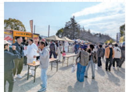
飲食ブース也大盛況