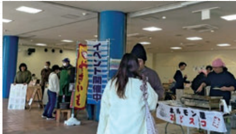
初出店のやきいもは完売した