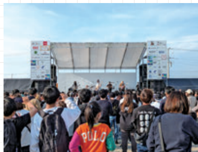
アーティストと共に盛り上がる来場者