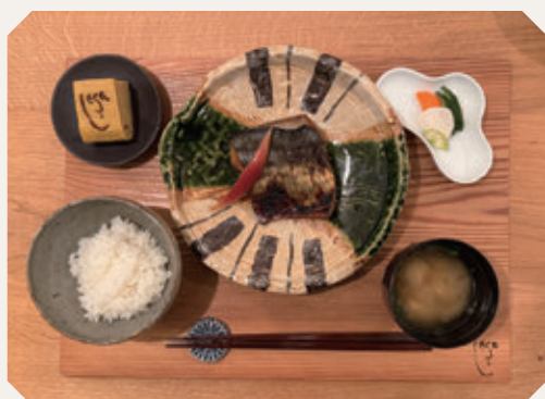
「メイン料理とお食事」

「おいしいものを食べることと、人と話すのが大好き」というご夫婦の想いが詰まった「手しごとごはん こさえる」で、心温まる創作和食をぜひお楽しみください。