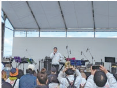
オープニングで挨拶する成川会長