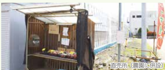
直売所（農園に併設）