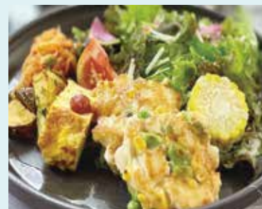
枝豆コーンのゴロゴロチーズ焼き