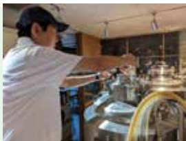
店内からも様子が分かる醸造所

夏の限定ビール「クールブリーズピルス」は、日本の蒸し暑い夏に涼風を感じさせる爽やかなピルスナーです。