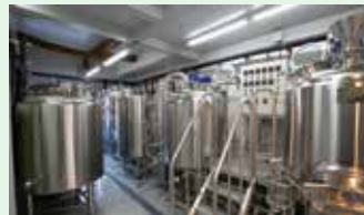
三島駅から直ぐの場所にある醸造所

fete (フェット) 三島醸造所/allez は、三島駅徒歩3分の板金工場と民家をリノベーションして誕生した醸造所レストランです。「四季折々の地元の食材を使い、おいしい、楽しい、食卓を作ろう!」をテーマに、フレンチベースの料理や自家醸造のクラフトビール、フルーツのスパークリングを提供しています。地元の食材を使用し、料理に合うすっきりした味わいと複雑な香りが特徴です。すっきりした味わいを実現するため、2種類の熟成タンクを使い、丁寧な管理とテイスティングを行っています。香りの面では、女性ソムリエや地元の女性アーティストが企画・デザインを担当し、繊細な味わいや独自の世界観を表現しています。