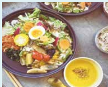
夏野菜と豚ロースの黒酢あん

メニューは、地元農家から取り寄せた新鮮で美味しい野菜をふんだんに使用した料理が自慢です。ランチとディナーの時間帯に合わせたバリエーション豊かなメニューを取り揃えています。特におすすめは、どの料理も見た目が美しく、味わい深い一品です。