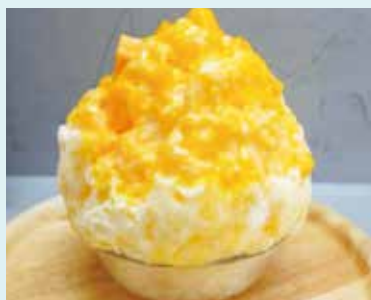
三島マンゴーを贅沢に使用したマンゴーかき氷

7月～9月の期間限定でかき氷を販売しています！ふわふわ氷がモリモリで、ボリューム感のあるかき氷に地元野菜とフルーツを使った自家製シロップがやみつきになります。