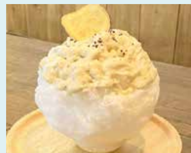
三島甘藷を使用したかき氷