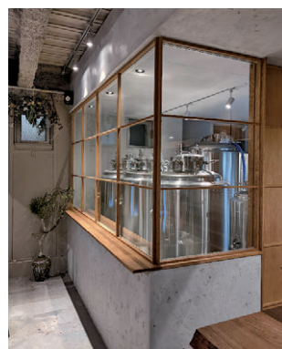
店内にある醸造所