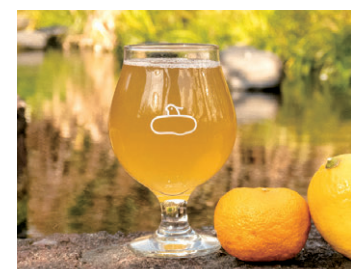
沼津産を使った「柚子&レモンゴーゼ」