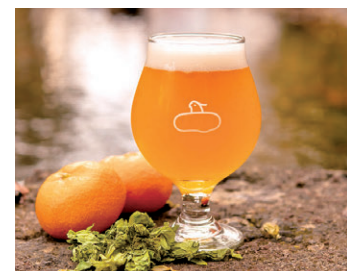
由良みかんウィート