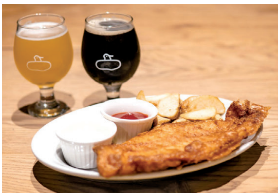
お店おススメのフィッシュ&チップス