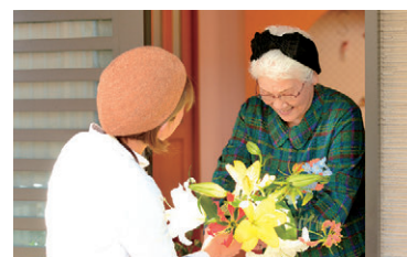
プチ見守りの様子