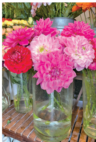
春にピッタリなダリア

このサービスは、なかなか帰省ができない状況でも花を通じて家族の絆を深めるお手伝いをするだけでなく、プライバシーを尊重しながらプチ見守りをする事で親御さんが生活に潤いを感じ、親しみ慣れた地域で生活をし続けることを可能にしています。同時に、この取り組みはSDGsのゴールである「住み続けられるまちづくりを」にも寄与しています。地域社会との結びつきを強化し、家族や高齢者が自らの生活を豊かにし、安心して住み続けるための一翼を担っています。