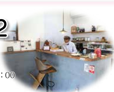
こじんまりとした落ち着いた雰囲気店内

住所：三島市大場366-9 TEL：070-6410-2778 営業時間：平日・土曜 10:00～17:00 日曜 13:00～18:00 定休日：月・水・金