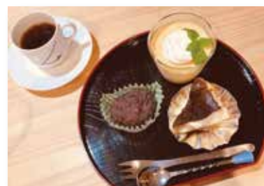
珈琲と一緒に人気のお菓子も人気です