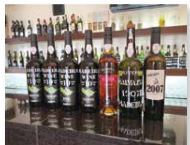
ポルトガルワイン

【特典・サービス】BE. ME 3月号持参でポルトガルの微発泡ワインヴィーニョ・ヴェルデをグラス1杯サービス(※昼・夜問わず)