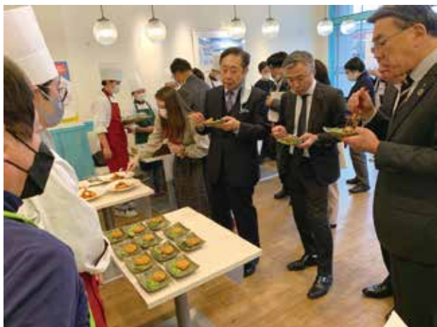
鈴木学園「ティファニー」での試食会

また、開発商品の中の一つで、お食事処源氏の「伊豆メンチ」については、後日静岡県立三島南高等学校でテスト販売をし、用意していた200個は30分を待たずに完売しました。購入した生徒からは「意外とあっさりして美味しい」「鹿肉とは思えない初めての触感」など大好評でした。（文：まちづくり課 大嶋孝博）