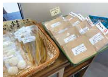
お持ち帰り用のドリップパックは3種類の違った味が楽しめます