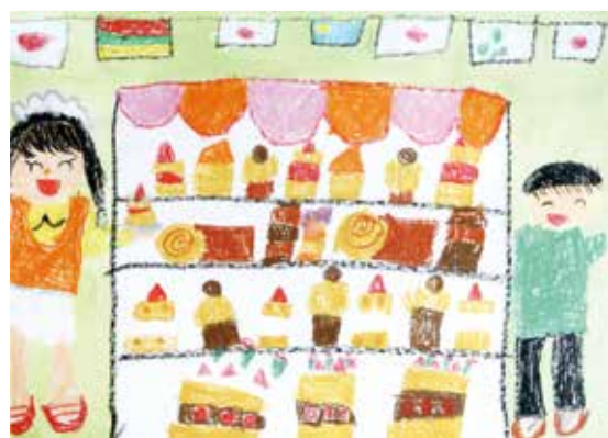
画題「けーきやさんになりたいな」