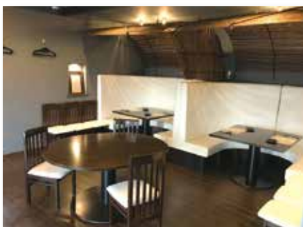
2階にもスペースがあります