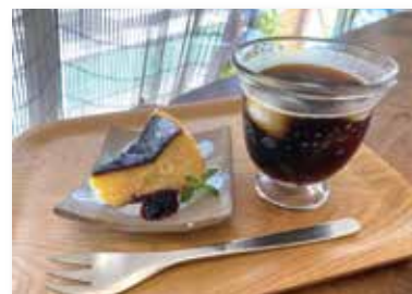
珈琲とバスクケーキ