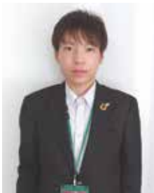
まちづくり課 書記