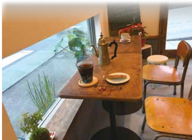
レトロな雑貨が並びます

【特典・サービス】 BE. ME 3月号持参で飲食された方に ドリップパックを1つプレゼント!