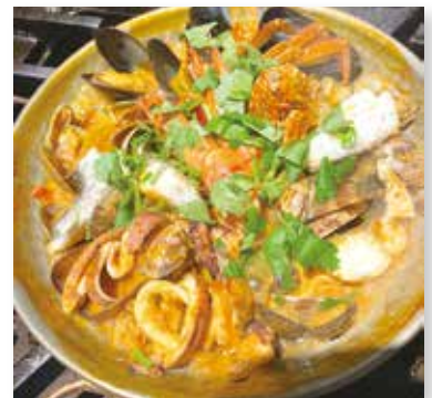
魚介のカタプラーナ