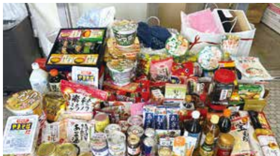
ご協力いただきありがとうございました！

誰でも気軽に参加が出来る慈善活動ですので、これからも女性会ではこのような社会貢献活動に取り組んでいきます。ご協力頂きました事業所の皆様、ありがとうございました。（文：総務課 轟田美咲）