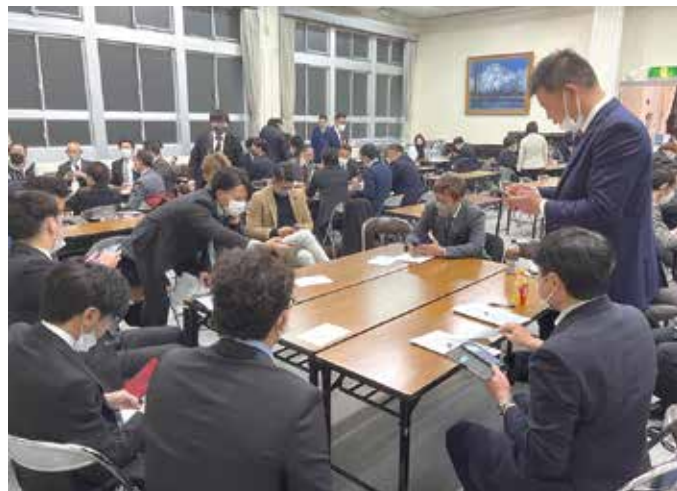
次年度委員会メンバー顔合わせ