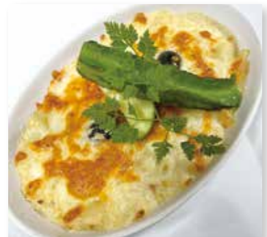
バカリャウのグラタン