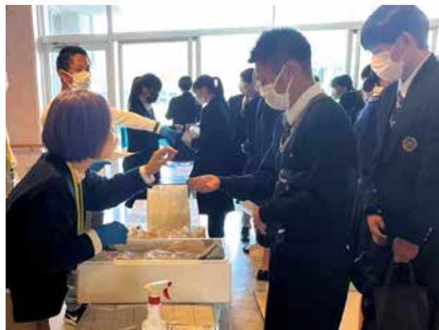
三島南高校でのテスト販売