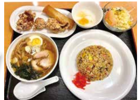
1番人気のぐるめんセットA