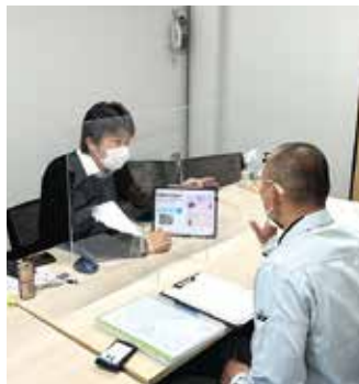
インボイス制度(松井氏)