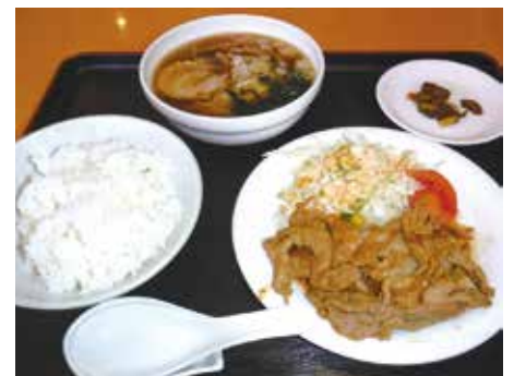
ボリュームあるランチもおすすめ!