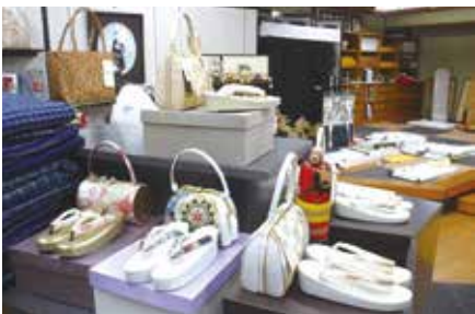
美しい日本の伝統文化