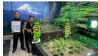
※人工わさび田で環境保全を学ぼう！

株式会社山本食品は、創業明治38年の地域で老舗のわさび漬等の製造・販売会社です。企業コンセプトである“わさびを、もっと、おもしろく。”を念頭に、2022年9月1日にSDGs宣言をし、食品ロス削減や環境保全等に積極的に取り組んでいます。