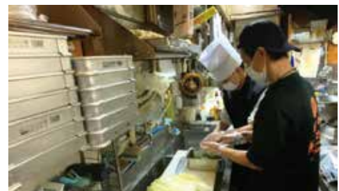
さんさん食堂さん試作