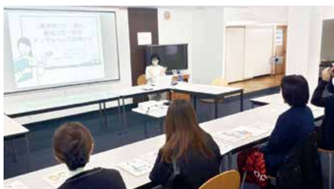
企業での研修の様子