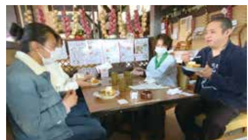
マリオパスタさん試作