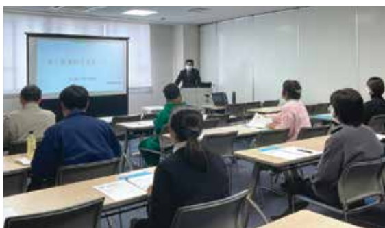
電子帳簿保存法について真剣に学ぶ受講者の皆様