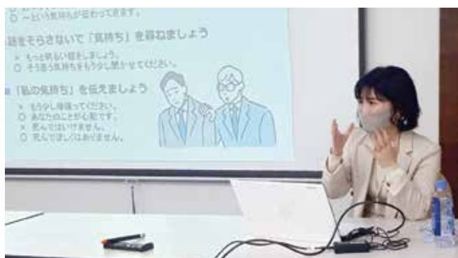
三島市の保健師が講師を務めます。