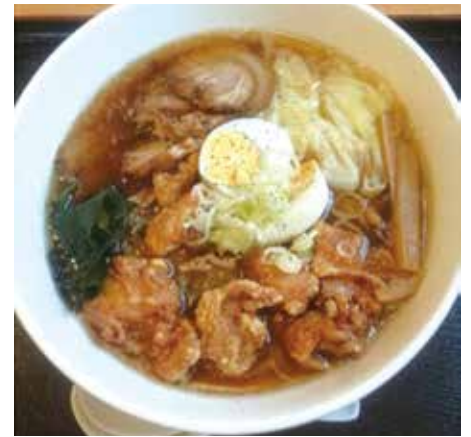
ガッツリ! らーめんデラックス

色々なメニューを楽しめる「ラーメンレストラン ぐるめん」にお気軽にお出かけ下さい。(文: まちづくり課 石渡智英)