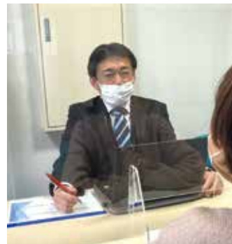
電子帳簿保存法(根津氏)