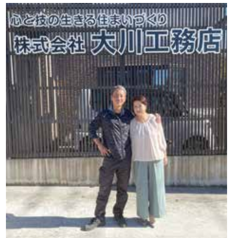
仲良しな社長ご夫妻