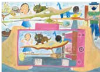
「写真の中のきょうりゅう」