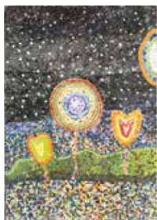
「キラキラな夜空ときれいな花火」