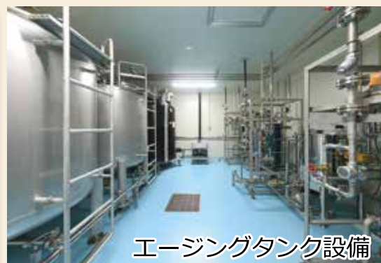
エージングタンク設備