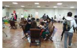
11店舗が出店しました

当所TMOホールでは会員11店舗が出店し、当日はあいにくの雨でしたが多くの人でにぎわいました。(文:まちづくり課 坪内美奈)