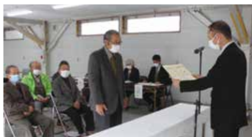
楽寿園岩崎園長(代理)から賞状を授与