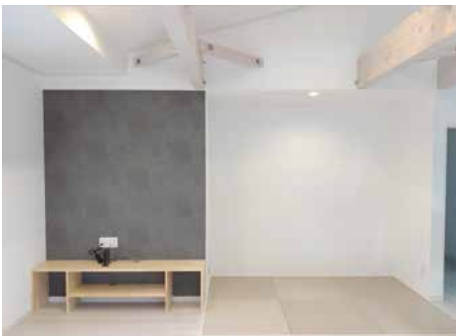
ぬくもりを感じる空間