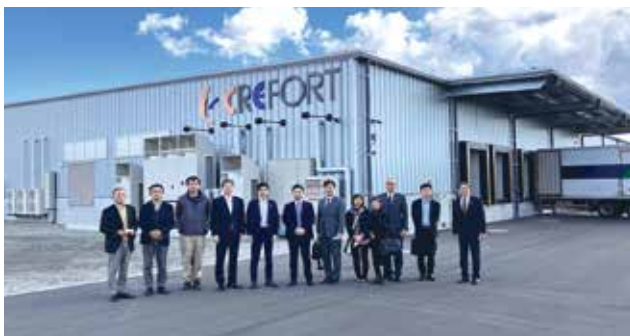
クレフォート東日本(株)さんと集合写真