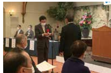
代表者による謝辞