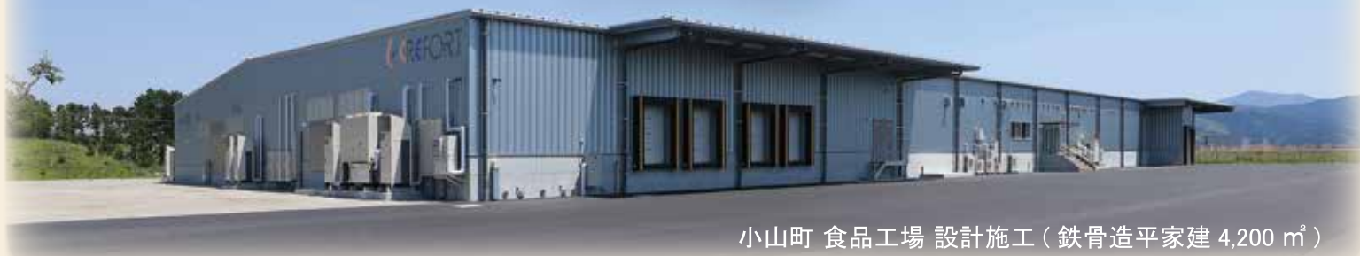
小山町 食品工場 設計施工（鉄骨造平家建 4,200 m 2 ）