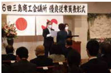
石渡会頭より賞状を授与