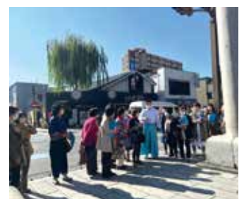
神主さんから三嶋大社の歴史を説明