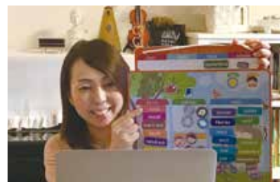
オンラインでプライベートレッスン

フランス語とフランス語圏の文化をより多くの人に知ってもらうために地元のレストランとコラボし、年4回ほどイベントレッスンを開催しています。在籍していなくても参加ができるイベントレッスンは毎回好評です。「フランス語を話せる人を増やして、ゆくゆくはフランスとの直接的な関わりを増やしていきたい。南フランスと似た雰囲気を持っている三島の活性化を図りたい」と抱負を語りました。(文：総務課 鶴田美咲)