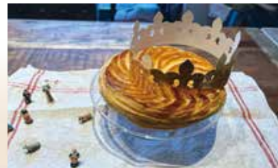
イベントレッスン「ガレットデロワ」